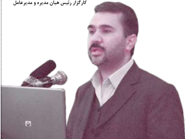
رئیس ستاد اولین المپیاد قرآنی: