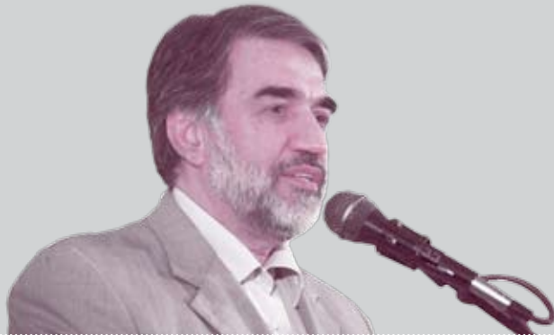
دبیر شورای عالی فناوری و اطلاعات کشور: